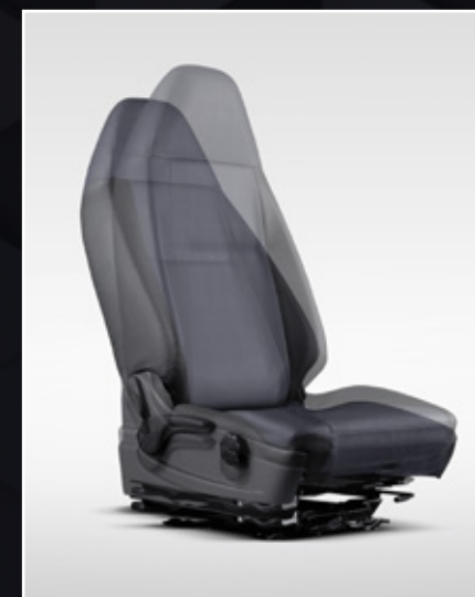
AIR SUSPENSION SEAT