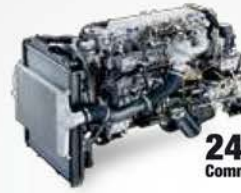
240PS Common Rail